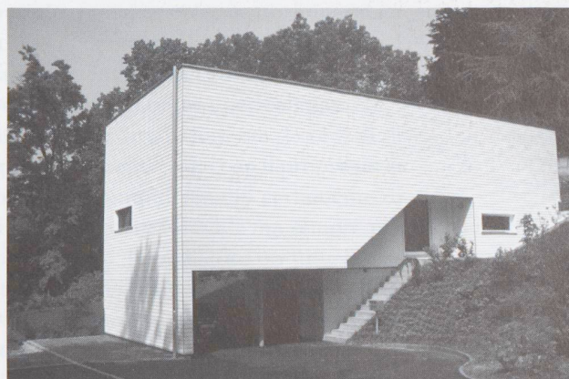
Gli esterni si adattano ad ogni ambiente (casa Heitmann - Vacallo, architetti M.Cattaneo e G. Birindelli)