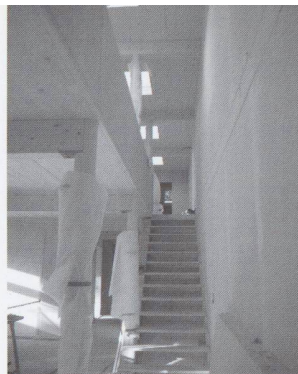
Gli spazi interni sono facilmente adattabili a nuove esigenze (casa Heitmann - Vacallo, architetti M.Cattaneo e G. Birindelli)

Chi fosse interessato a maggiori informazioni sia sui progetti sostenuti, che sulle modalità d'iscrizione, potrà ottenere le informazioni necessarie al sito HYPERLINK http://www.holz2000.ch oppure contattando direttamente uno dei responsabili del progetto: