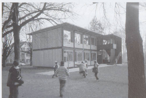
Scuola materna costruita con elementi modulari prefabbricati Zurigo-Gubel, scuola materna città di Zurigo, Bauart Architekten, Berna