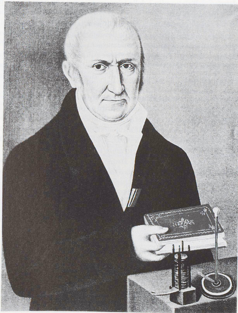
Alessandro Volta (1745 – 1827), l'uomo che ha acceso la lampadina duecento anni fa

Le celebrazioni per una delle invenzioni piú rivoluzionarie che hanno caratterizzato l'era dell'elettrologia – appunto l'invenzione della pila – sono in corso già da alcuni anni. Piú precisamente dal 1995. Innanzitutto perché in quell'anno cadeva un anniversario di grande rilevanza commemorativa: Alessandro Volta nacque infatti 250 anni prima, ma anche per il rilievo cruciale che il 1795 – e quindi 200 anni prima – ebbe nell'iter delle sperimentazioni che portarono alla scoperta della pila. In quell'oramai lontano e faticoso anno, Volta abbandona gli esperimenti