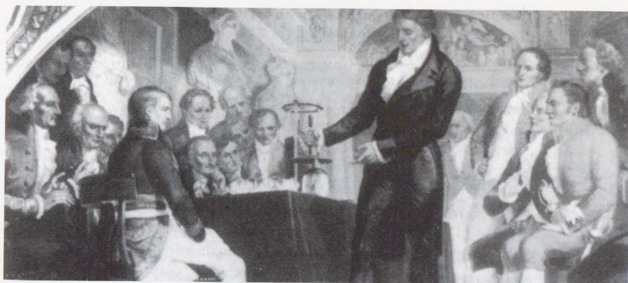
Alessandro Volta ospite presso Napoleone Bonaparte (1801)

All'inizio della controversia, nel 1792, i programmi di ricerca dei due scienziati erano ben avviati e, ovviamente, ben diversi. Galvani credeva fortemente in una elettricità «animale», cioè in uno sbilancio elettrico che si originava negli animali, indipendentemente dagli stimoli elettrici esterni (ad esempio quelli provocati dai metalli). Galvani ebbe il merito di portare la fisiologia tra le scienze sperimentali, sottoponendo per lunghi anni i fenomeni individuati in accurati esperimenti di cui annotava con grande precisione i risultati. L'obiettivo di Galvani era di rendere sensibili le ipotesi occulte dei fenomeni ed eliminare così dalla fisiologia le spiegazioni metafisiche. Il programma di ricerca di Volta – come già detto – era ben diverso, molto più complesso e originale. Volta infatti cercava di interpretare, con un approccio di tipo lineare, tutto il settore del-