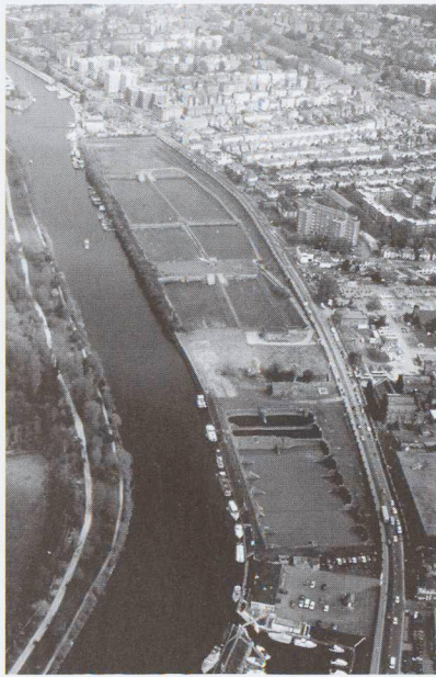
Impianto idrico dismesso a Seething Wells, Kingston sul Tamigi