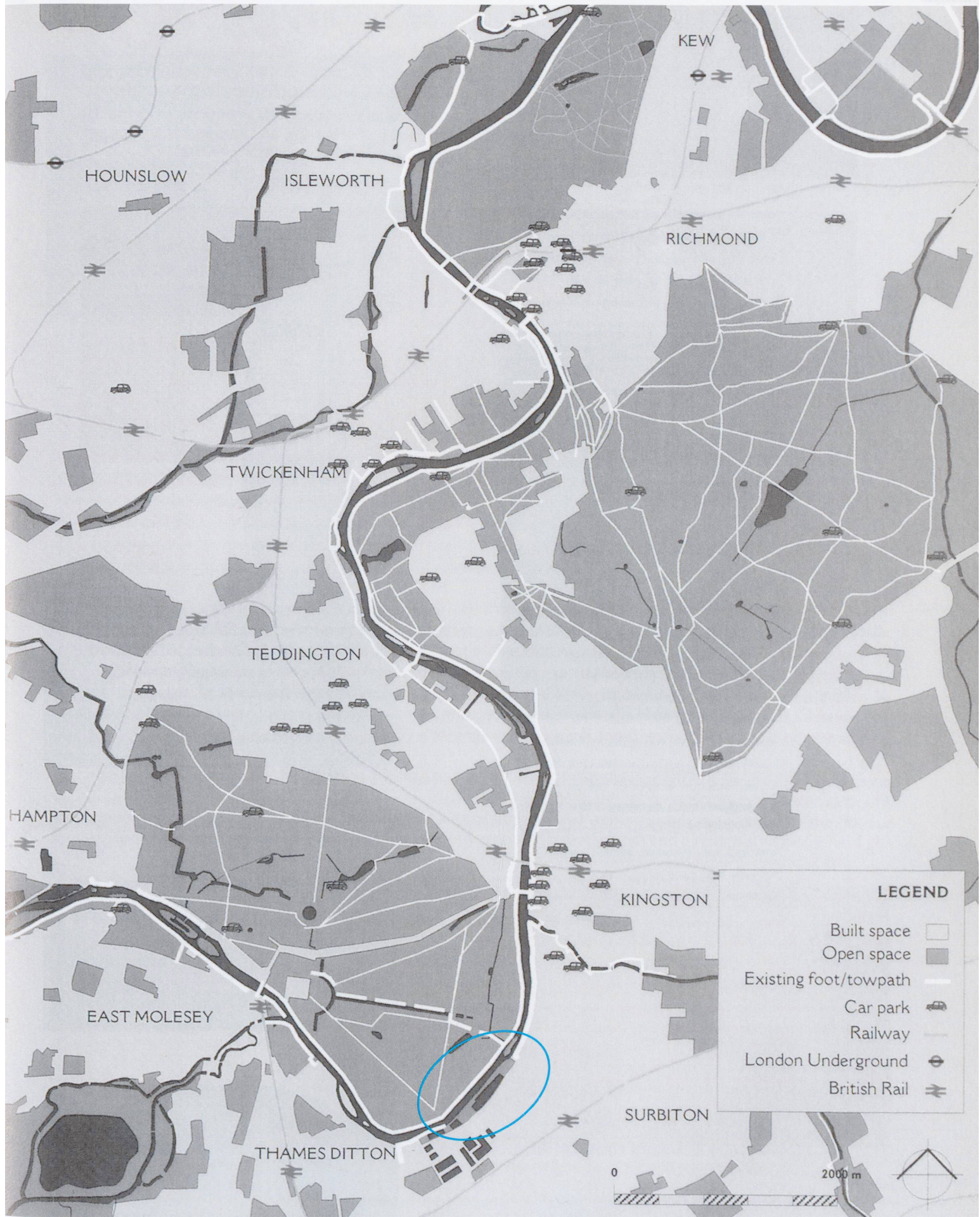
Accessi pubblici e spazi aperti