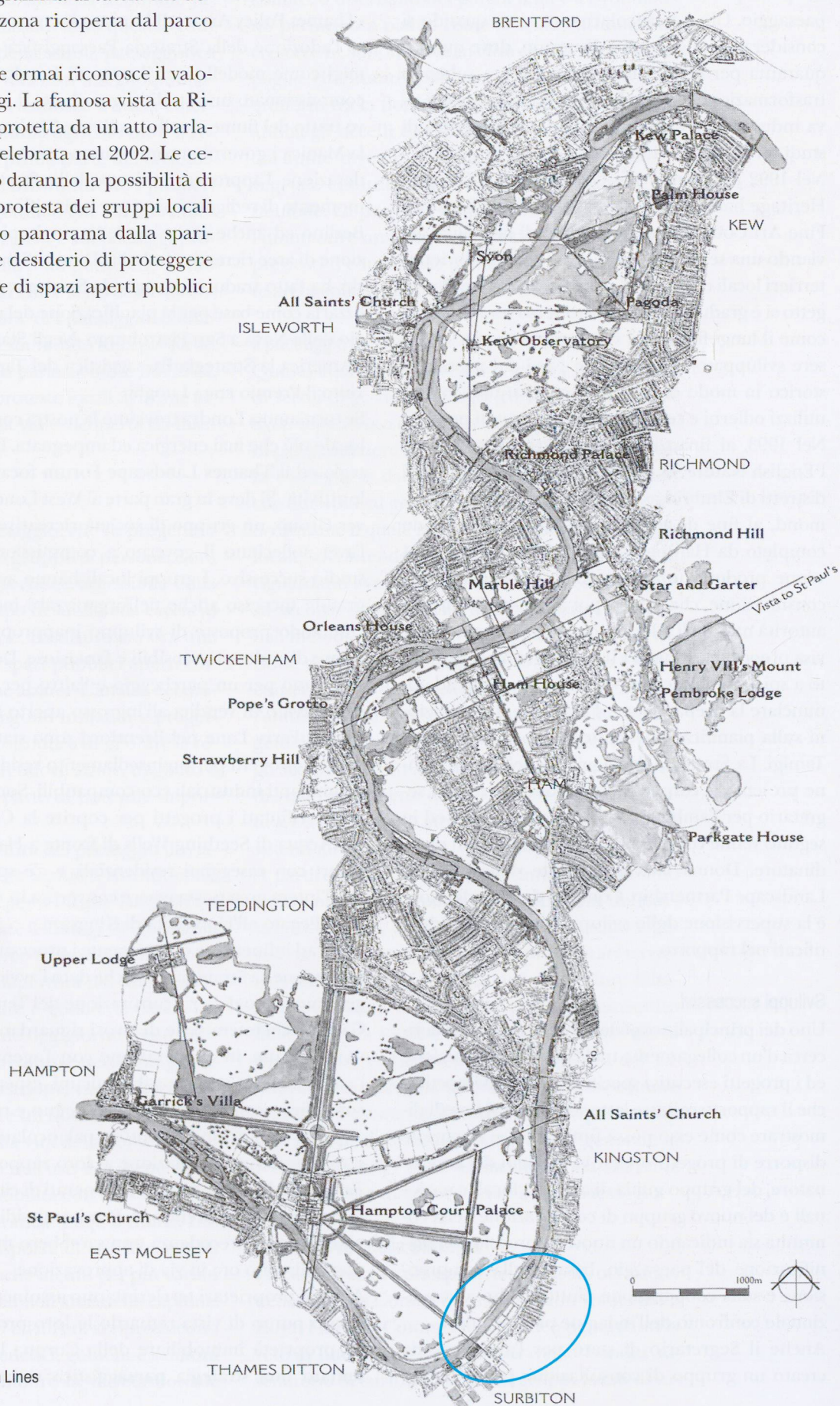
Thames Vista Lines

Per finire, tutta la capitale ormai riconosce il valore delle vedute del Tamigi. La famosa vista da Richmond Hill, che venne protetta da un atto parlamentare nel 1902, sarà celebrata nel 2002. Le celebrazioni del centenario daranno la possibilità di ricordare le riunioni di protesta dei gruppi locali per salvare un benamato panorama dalla sparizione, come pure il forte desiderio di proteggere un'intera rete di vedute e di spazi aperti pubblici per tutta Londra.