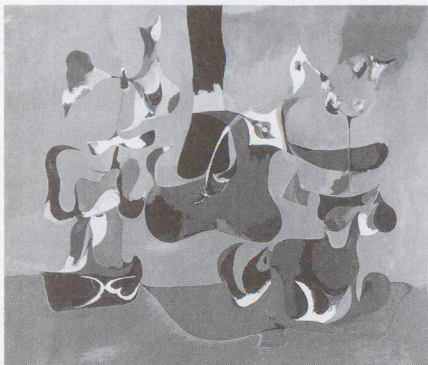
Arshile Gorky (1904-1948), Garden in Sochi , 1940, olio su tela 64x74 cm, collezione privata