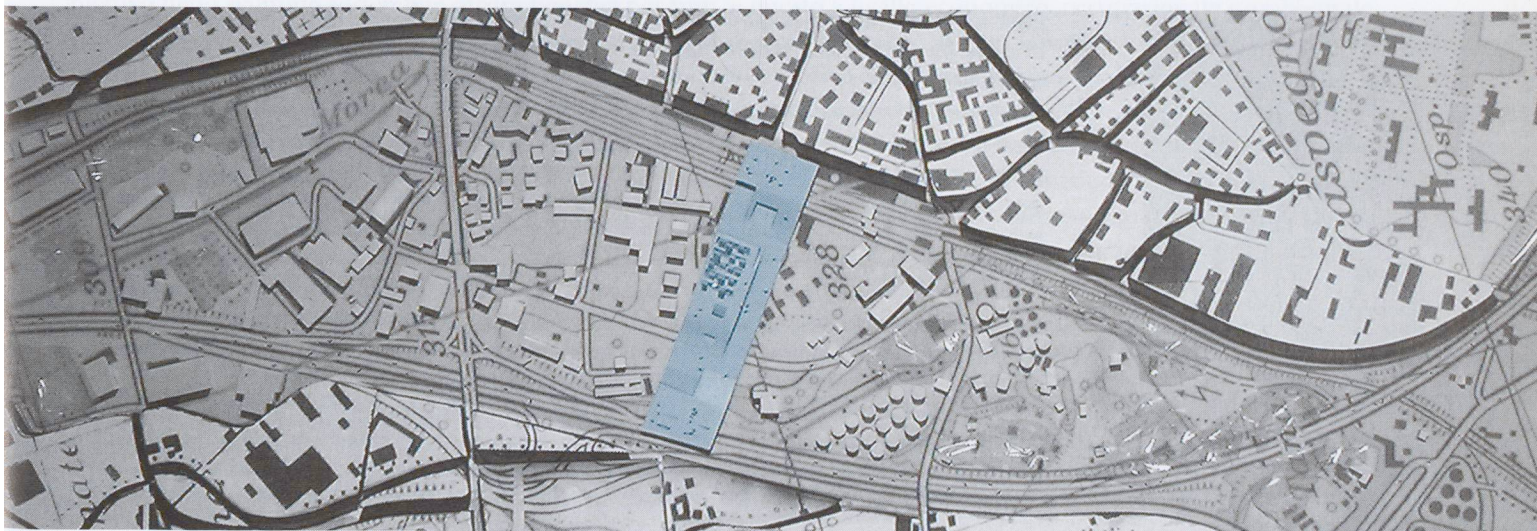
Foto zenitale del modello