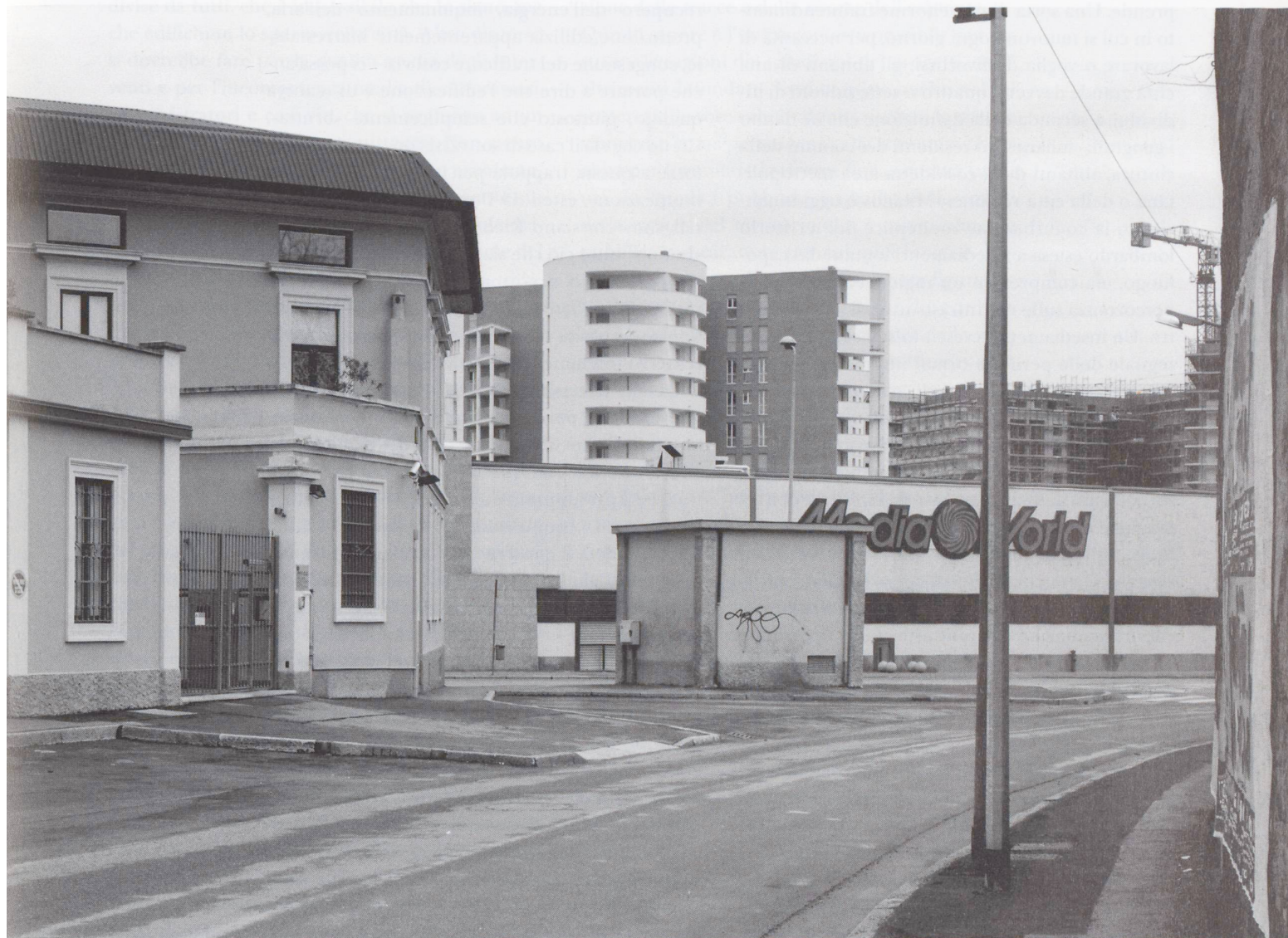
Due immagini emblematiche per le trasformazioni di Milano: in alto, il programma di riqualificazione urbana sull'area ex-Innocenti a Lambrate; sotto, la Bicocca degli Arcimboldi e il nuovo quartier generale Pirelli Re sull'area ex-Pirelli-Bicocca.