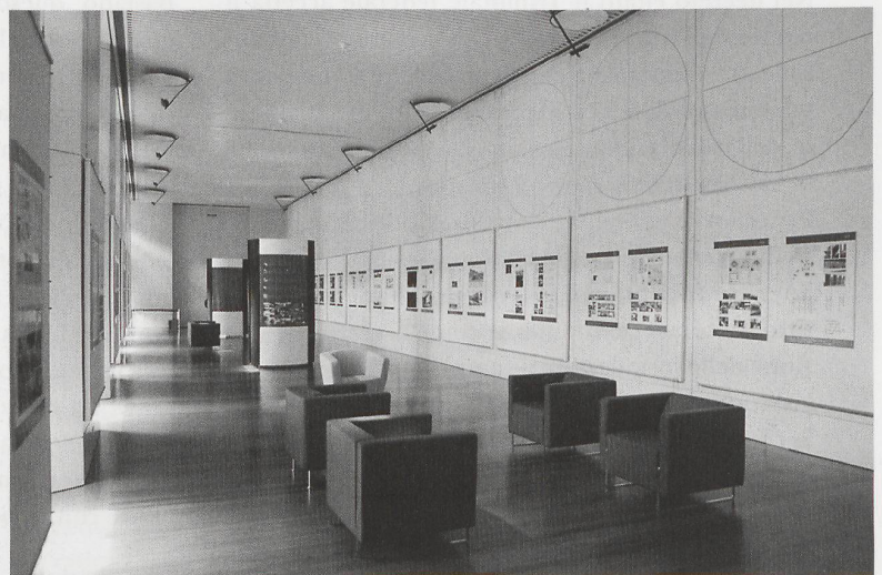
L'esposizione dei progetti presentati, alla sala dell'arsenale di Castelgrande a Bellinzona