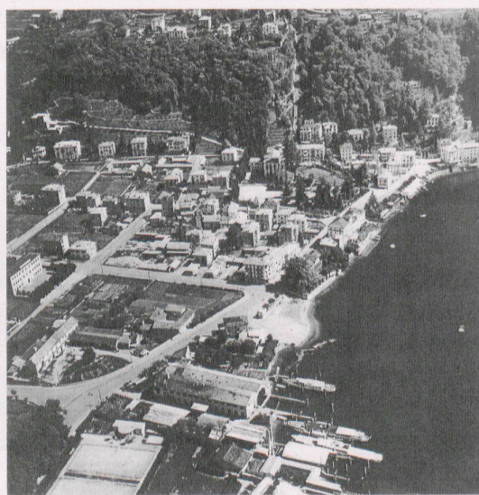
Veduta aerea di Cassarate verso il Brè, nel 1945.