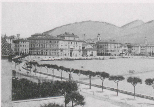
Il «quai» di Lugano, costruito tra il 1868 e il 1872 dall'ing. Pasquale Lucchini, in una fotografia anteriore al 1889.

È lungo questi assi che ha preso avvio, già negli anni '70 del 19. secolo l'edificazione della piana del Cassarate, nella periferia nord-est dell'antico borgo. Nell'ambito di questo sviluppo edilizio sorsero anche edifici importanti, quali il Pretorio, all'inizio della via per Trevano, chiamata poi appunto Via Pretorio, il ricovero per anziani «Pio Istituto Rizziero Rezzonico» alla Madonnetta e l'asilo Ciani in Piazza Castello; tra il 1906 e il 1908, più a nord, sorse l'imponente complesso del nuovo Ospedale Civico, che s'impose come importante polo del nuovo quartiere.