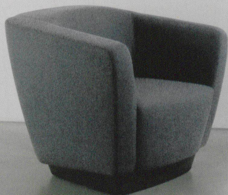
Rivo. Design Hannes Wettstein.