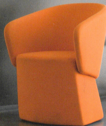
Tulo. Design Shin Azumi.