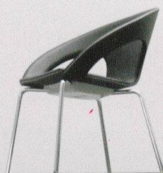
Kirkos. Design Wolfgang C. R. Mezger.