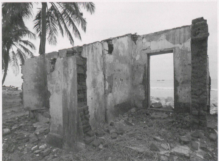
Fig. 1 – Casa distrutta dallo tsunami del 26 Dicembre 2004, stato del Tamil Nadu, India