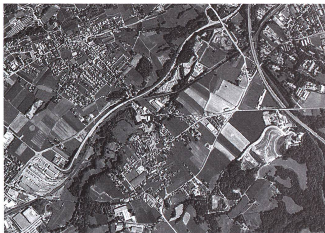
Il fiume Laveggio e il comparto Valera: un vasto territorio che potrebbe costituire un fulcro di grande valore nel paesaggio – un parco al centro del Mendirisiotto