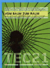
Tec21 n.07 Vom Baum zum Raum www.tec21.ch