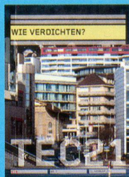
Tec21 n.07 Wie verdichten? www.tec21.ch