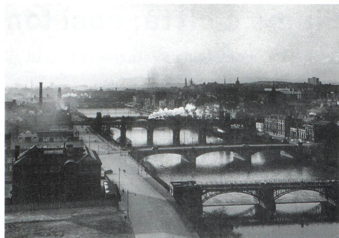
1. Glasgow: i ponti sul fiume Clyde, 1963.

«Il Tamigi e Londra, dunque: – è ancora Mario Maffi 6 che parla – il rapporto fra una città e un fiume è un dialogo ininterrotto, un gioco di specchi, un pageant senza fine in cui palcoscenico e platea non cessano di scambiarsi di posto. Penso inevitabilmente alle molte città incontrate lungo altri fiumi, a come mutasse quel rapporto a seconda della reciproca posizione: città dalle topografie stranamente intrecciate e sovrapposte da una riva all'altra, a disorientare mentre si va in giro; città contrapposte, da riva a riva, con in mezzo il fiume, quasi a fare da specchio deformante; città che, dall'alto di costoni o di colline, scrutano l'ansa laggiù, in basso, quasi a sorvegliare lo scorrere del tempo... Ma Londra è diversa: Londra è una «città attraversata», una città che racchiude il fiume nel proprio cuore...».