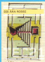
Tec21 n. 25 Die Ära Rossi www.tec21.ch