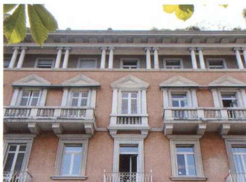
Mario Chiattone, Palazzo Bianchi a Lugano, 1927

Terzo pilastro: la gerarchia. Già, perchè è proprio nel mettere nell'opportuna scala gerarchica i valori naturali e quelli antropici, i pieni del costruito e i vuoti di strade e piazze che si fa la differenza tra una città bella e una città brutta. Del resto, molte sono le città prive di monumenti particolari o di paesaggi suggestivi, eppure sono comunque delle belle città, in cui è bello vivere o visitare. Mi si dirà che fare queste tre cose, erigere (metaforicamente) questi tre pilastri significa fare un progetto. Risposta: è vero.