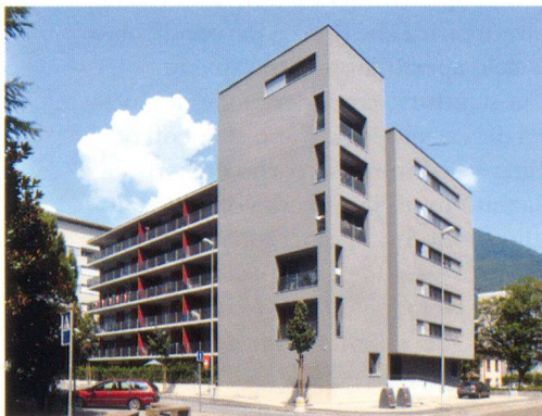
Grasso e Giordani edificio d'angolo a Lugano Molino Nuovo, 2009