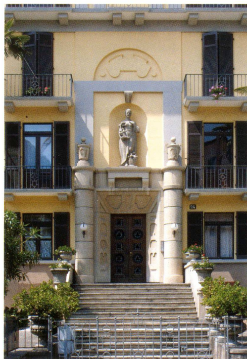
Giacomo Alberti casa in via Adamini a Lugano, 1925

È vero, la stragrande maggioranza di quello che si costruisce è architettura di scarsa qualità, tra il brutto