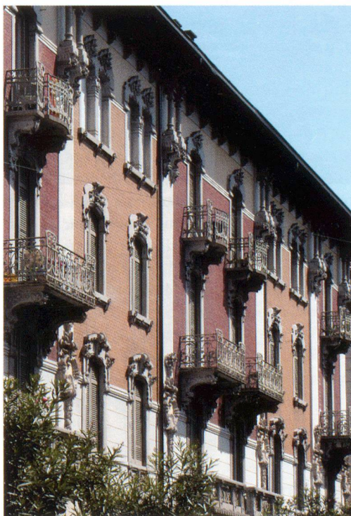
Giuseppe Bordonzotti casa in via Lucchini a Lugano, 1905

È vero, dal nord al sud del Ticino le ville storiche con i loro giardini «a mo' di parco» cadono le une dopo le altre o sono sfigurate, e pezzo dopo pezzo i quartieri storicamente unitari si smembrano. Furrer lamenta la mancata protezione di questi edifici, e ha ragione.