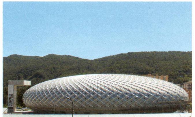
Centro commerciale «Ovale» di Chiasso