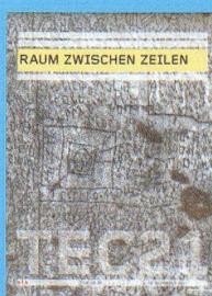
Tec21 n. 51-52 RAUM ZWISCHEN ZEILEN www.tec21.ch