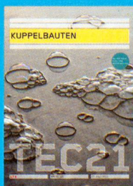
Tec21 n. 31-32 KUPPELBAUTEN www.tec21.ch