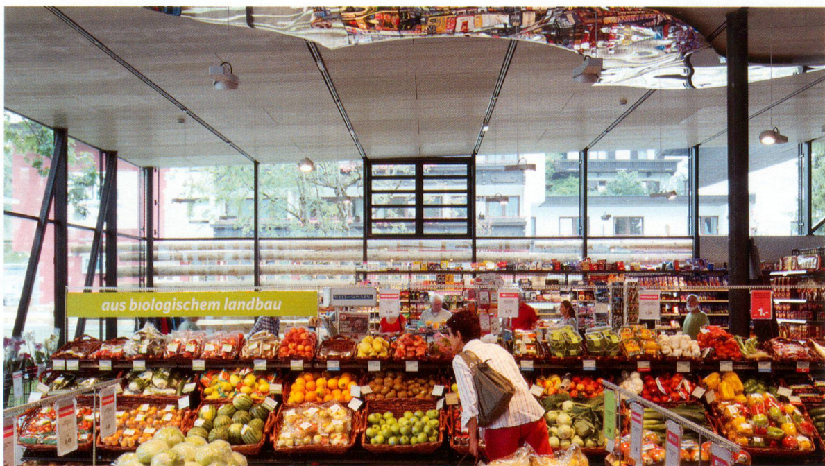
Dettaglio degli spazi interni con i medaglioni di specchio disegnati da Franz Mölk per i soffitti.

Difficile rispondere in generale. Molte realtà infatti non sembrano cambiare, ma dal mio punto di vista oggi viviamo più che una crisi un periodo di mutamento e trasformazione che farà assumere anche allo shopping un carattere diverso e più ampio, nel quale questo tipo di architettura non sarà più fatta di edifici isolati, staccati dal resto e sviluppati con poca attenzione. Penso inoltre che il formalismo e l'ego del designer debbano fare un passo indietro, per lasciare spazio ad un'architettura integrata con il contesto e con la vita umana: un messaggio per la nostra sopravvivenza e per una migliore qualità della vita.