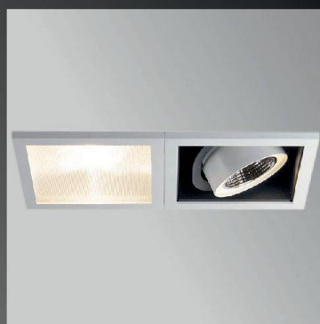
MESON 180 MULTIPLE Sistema di luce LED combinabili individualmente

Tic Illuminazione Ufficio Ticino: 091 941 23 70 info@tic-light.ch , www.tic-light.ch