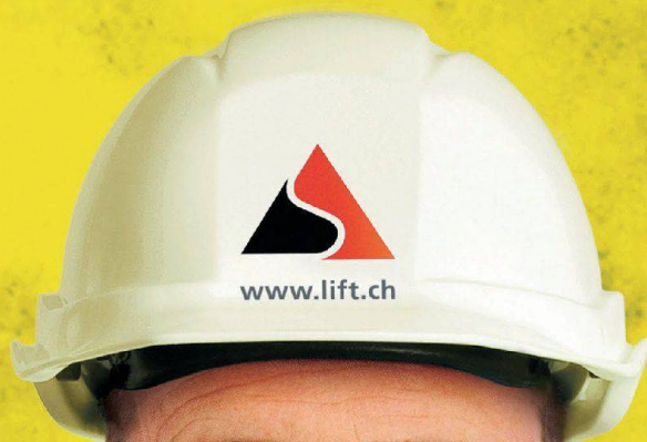
René Risi Responsabile di vendita