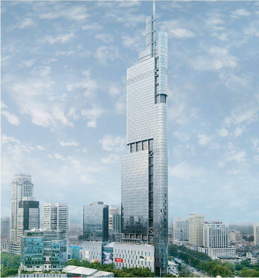
Financial Center, Nanjing