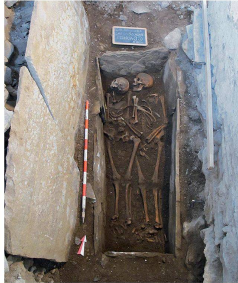
3. - 4. Rossura. Chiesa dei SS. Lorenzo e Agata con cimitero e dettaglio tomba

di sagrati utilizzati come luogo privilegiato di radunanza della comunità, ma anche come cimiteri, sorretti e cintati da solidi muri, con al centro un'alta e raffinata croce, un ossario ben visibile, un portale dipinto e in qualche caso (ma questa è un'aggiunta settecentesca) una Via Crucis monumentale per sottolineare la sacralità del sito (Mondada 1974; Rüschi Carazzetti 1992). Ma le Istruzioni di Carlo Borromeo toccavano anche un altro aspetto delle pratiche funerarie, ossia l'usanza, sempre più diffusa tra la fine del Medioevo e il Settecento, di deporre i defunti in camere mortuarie poste all'interno delle chiese. Anche questa è una situazione ampiamente riscontrabile negli edifici sacri esistenti sul territorio ticinese: ad esempio nella chiesa parrocchiale di Santa Maria Assunta a Caneggio, quattro lapidi collocate nel pavimento della navata nel 1754 ricordano la destinazione delle grandi camere mortuarie sotto-