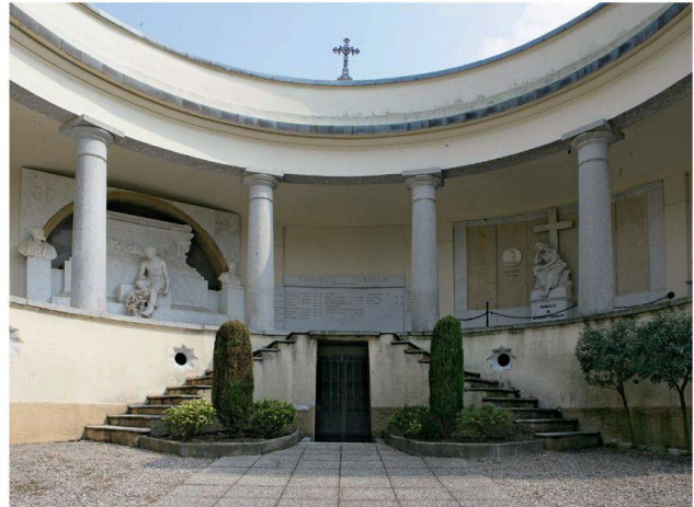
9. - 10.