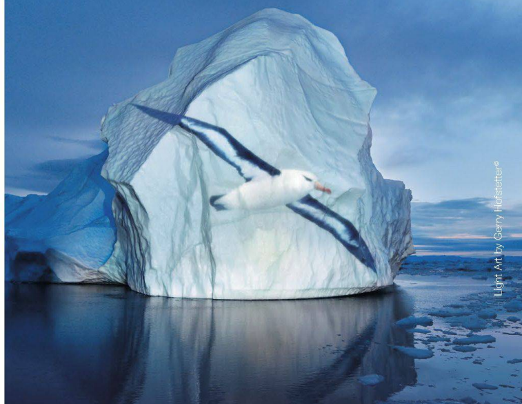
Light Art by Gerry Hofstetter