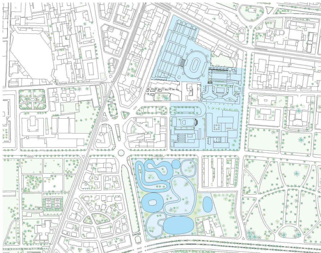
Planimetria generale con evidenziate le aree dei campus

e spazi comuni – l'ingresso sembra sfumare in una sovrapposizione di trasparenze che, in previsione, potremmo associare a progetti come il Museo d'Arte Contemporanea di Kanazawa in Giappone (2004), dove il perimetro curvo del complesso contribuisce a dissolvere la forma complessiva dell'edificio (un enorme cerchio) in prospettive continuamente mutevoli. Sul fronte ovest si affaccia il volume ellissoidale dedicato ai corsi di Master, nel quale alle aule tradizionali (che si sviluppano seguendo la curvatura del perimetro) si sommano aule «auditorio» – con sedie e banchi mobili, che permettono una riconfigurazione libera in base alle esigenze didattiche – e «scatole» (box) per piccoli gruppi di studenti. Verso sud è invece previsto il Recreation Center , centro per lo sport e il tempo libero che sarà aperto a tutta la città, con palestre e una piscina olimpica da 50 metri. Sul lato opposto – verso il parco, nel settore più tranquillo dell'area – sverterà una torre residenziale di pianta ellissoidale di 18 piani con 300 posti letto per studenti e visiting professors .