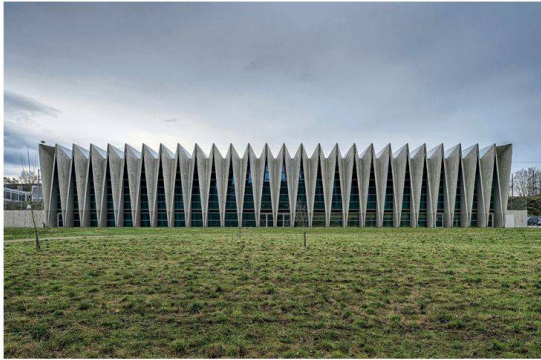
Elegante struttura in lamiera piegata: centro di formazione sportiva Müllmatt, Brugg Ingegnere civile: Fürst Laffranchi Bauingenieure GmbH, Wolfwil; Architetto: Studio Vacchini Architetti, Locarno. Foto: Christian Beutler / NZZ).