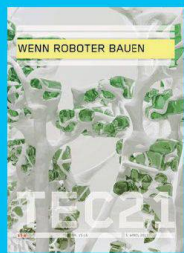
Tec21 n. 15-16 WENN ROBOTER BAUEN www.tec21.ch