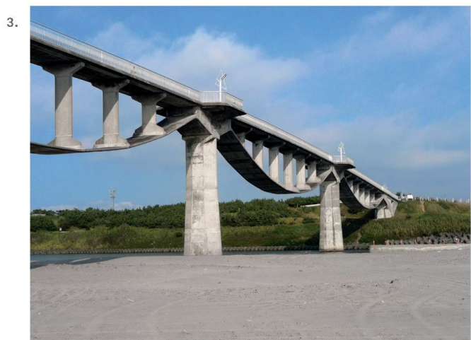
3. Shizuoka Construction Technology Center, ponte Shiosai, Fiume Kikugawa, prefettura di Shizuoka (J) 1995

Il presupposto è la riuscita combinazione di aspetti artistici e tecnici in una struttura portante innovativa, che sia il risultato di un processo progettuale avvincente, in cui competenze e abilità si mescolano con intuizione e fantasia. La struttura portante non è semplicemente un'impalcatura per sostenere i carichi, essa deve adempiere a numerosi compiti e presta un contributo sostanziale all'espressione formale dell'opera. Con quest'atteggiamento, gli ingegneri assumono non solo la responsabilità tecnica e costruttiva ma anche creativa, estetica e sociale, decretando l'arte ingegneristica come una parte della cultura edilizia.