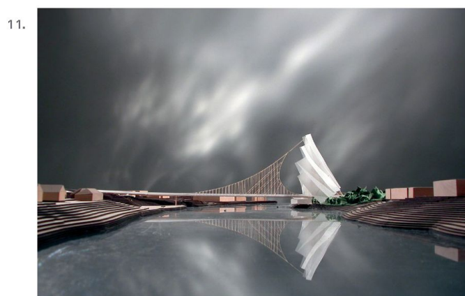
10. - 12. Jörg e Mike Schlaich con Frank O. Gehry, Workshop progettuale a Los Angeles, 2008 | Plastici di numerose varianti di progetto | Ponte sul fiume Wear, Sunderland (GB), Progetto, 2008. Foto Gehry Partners LLP