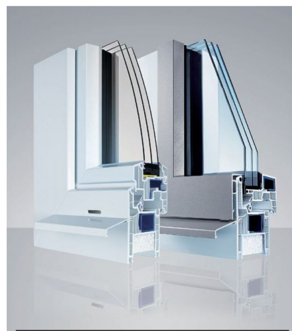
Finestre EgoKiefer di PVC e PVC/alluminio AS1® Isolamento acustico

Per maggiori ragguagli potete ordinare ora la documentazione o scaricare i modelli CAD per la progettazione al sito www.egokiefer.ch .