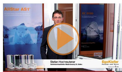
Leader di competenza finestre di PVC

MINERGIE® Come leadingpartner LEADING PARTNER MINERGIE® per porte e finestre, EgoKiefer offre il più completo assortimento di finestre e porte d'entrata certificate MINERGIE® e MINERGIE®-P della Svizzera.