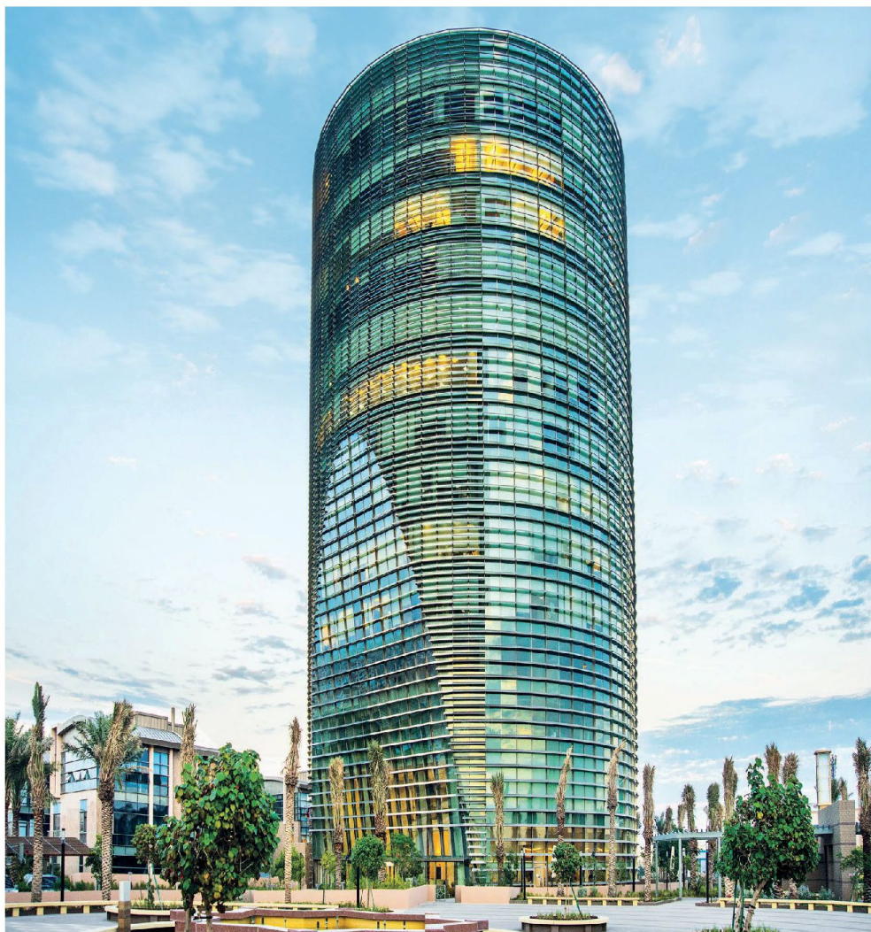
Alturki Business Park Al-Kohbar, Saudi Arabia