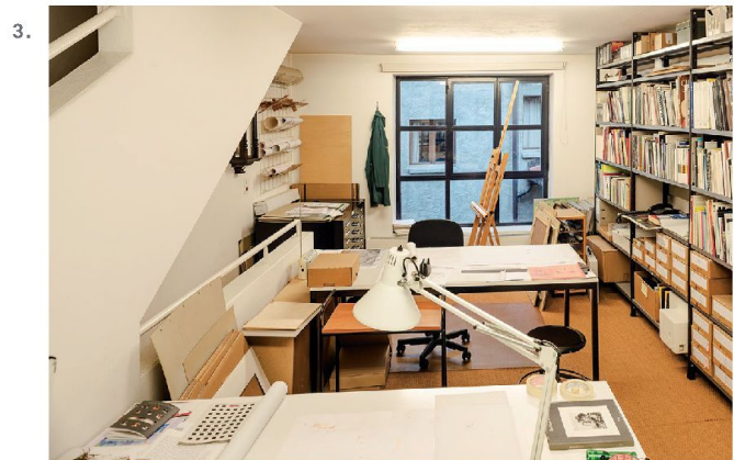
1.-6. Lo studio al piano terreno, l'ufficio al primo piano, l'atelier al secondo piano. Nella pagina seguente dettagli degli strumenti di lavoro.