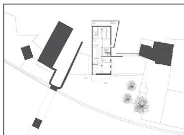
Canevascini & Corecco

1° rango 1° premio – «Quartz» Canevascini & Corecco; Lugano