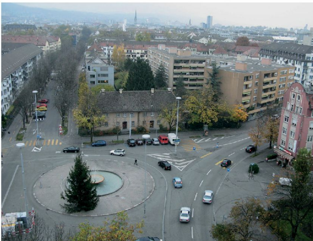
Zurigo, misure d'accompagnamento per la circonvallazione ovest 2012

I risultati sono sorprendenti: esistono davvero spazi di traffico orientati ai bisogni dei pedoni e i contribu-