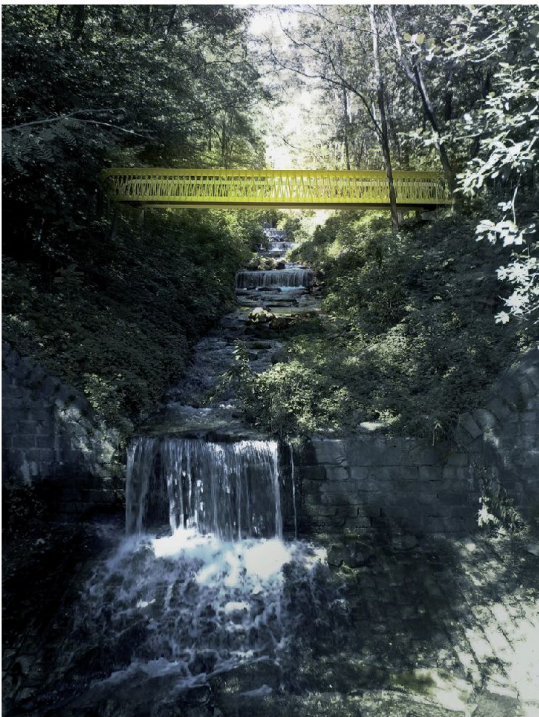
Lumino Bridge 2013

29 gennaio – 13 febbraio 2015 | lu-ve 8.00-17.00