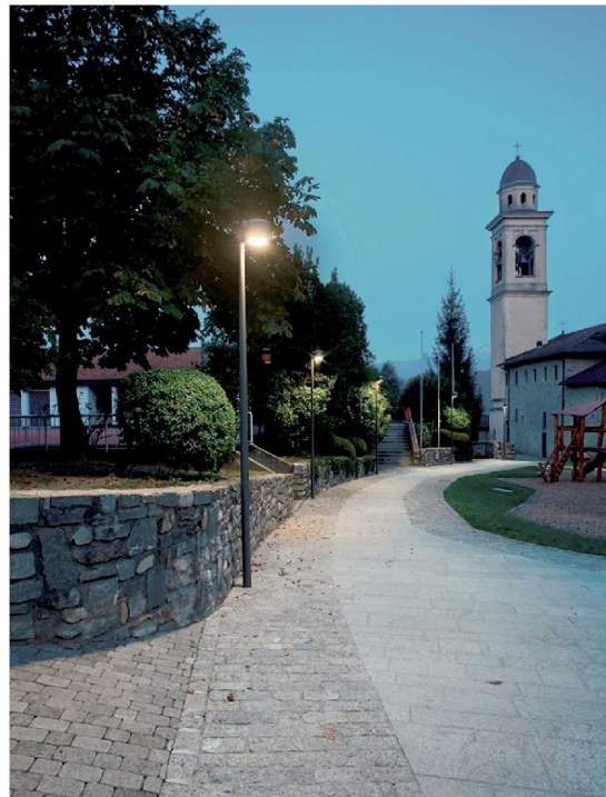
Pura, adeguamento urbanistico, lavatoio e cimitero 2011

Il nuovo ponte giallo è un esempio ben riuscito di statica ed estetica. La costruzione riflette il gioco delle acque del Riale Grande e stupisce per la particolare colorazione. Disegno e colore del ponticello non corrispondono a quelli dei comuni ponti pedonali e diventano un segnale nel paesaggio. Grazie alla nuova connessione si è venuto a creare uno spazio di alta qualità, il quale con le panchine sulla riva del Riale Grande disegna un luogo che invita alla sosta. Su entrambi i lati del ponticello le vie pedonali e ciclistiche continuano su strade a traffico ridotto e invitano a passeggiare. Questo progetto mostra che, anche con un budget ridotto, prestando attenzione all'ambiente circostante, si può raggiungere un ottimo risultato. Oltre al basso costo complessivo la giuria sottolinea anche l'installazione relativamente semplice del ponte: prefabbricato, fornito e posato sopra le sue fondamenta per mezzo di una gru, in tempi molto brevi.