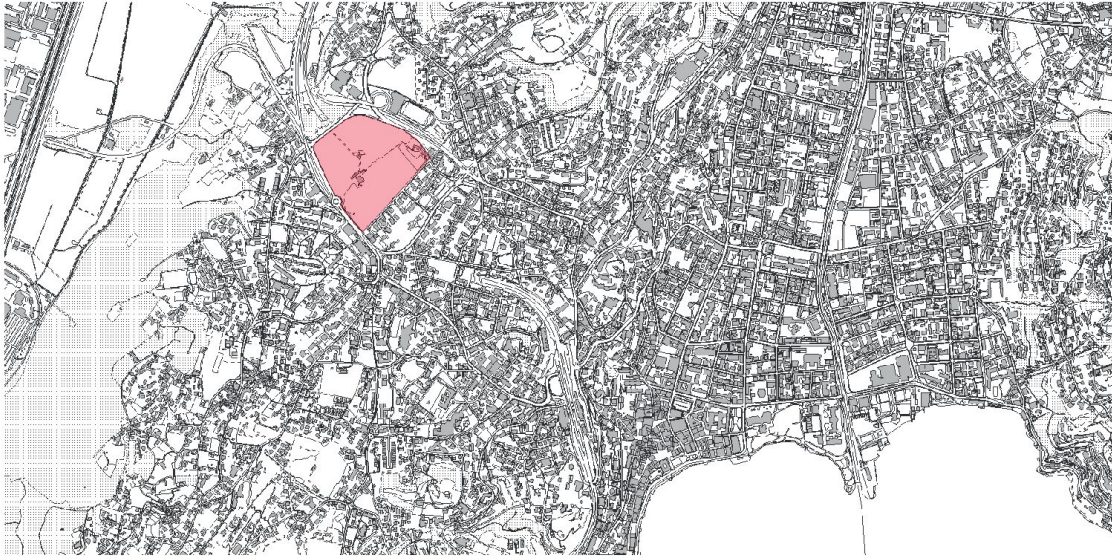
La collocazione del Pian Povrò nel tessuto urbano del luganese.

ma fatica. Il mercato immobiliare ticinese non esclude solamente i giovani, ma gli architetti, anzi l'architettura come disciplina in generale ... Nella Svizzera tedesca è successa una cosa interessante. Alcuni investitori hanno capito che la qualità architettonica ha un valore economico, è un "Mehrwert" come si dice in tedesco. Non mi faccio tante illusioni, ma questa dovrebbe essere la ragione principale per investire nell'architettura. Lo conferma – ed è importante non dimenticarlo – la presenza delle "Genossenschaften" e il loro merito nel costruire interi quartieri, con il risultato che è proprio l'architettura residenziale lo strumento principale per costruire la città. Evidentemente c'è una politica che sa negoziare e vendere meglio gli interessi della collettività, del territorio e del paesaggio».