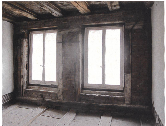
1.-2. Ristrutturazione di una casa del XVI secolo: risanamento delle murature.

La progettazione integrata, intesa come strumento per una buona riuscita del progetto realizzato: come viene affrontata con gli studenti? Vi sono scambi interdisciplinari con gli atelier di progetto. Può illustrare un esempio nell'ambito della didattica?