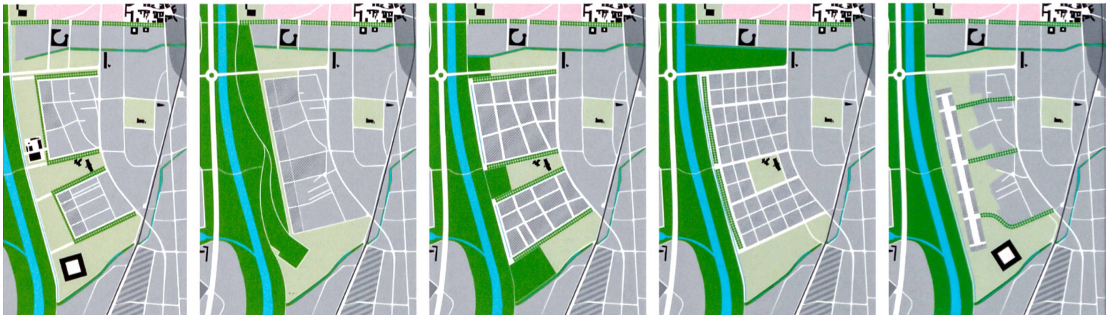
3. Varianti di progetto elaborate nel corso del seminario. Elaborazione grafica degli autori