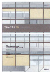
Tracés n.19 TSAM: sauvegarde de l'architecture du 20 e siècle 2 espazium.ch/traces