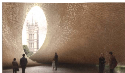
National Holocaust Memorial and Learning Centre Resi noti i nomi dei finalisti selezionati per il concorso. espazium.ch/archi

In copertina: Armando Ruinelli, Atelier di Miriam Cahn, Stampa.