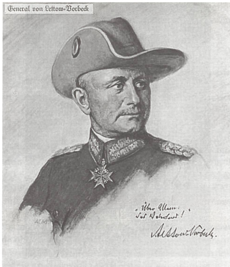
Lieutenant-colonel Paul von Lettow-Vorbeck, commandant de la Schutztruppe (forces coloniales allemandes de tirailleurs) de l'Afrique orientale allemande.

un « Plan 19 », qui était un projet de grande offensive blindée et motorisée pour le printemps 1919, projet qui annonçait vraiment la Deuxième Guerre mondiale et prolongeait les réflexions de Foch, auquel l'officier britannique soumit d'ailleurs son plan 32 . Et lors de la bataille d'Amiens, le 8 août 1918 (« Jour noir » de l'armée allemande!), l'armée britannique engagea avec grand succès douze bataillons de tanks (environ 400 machines) 33 .