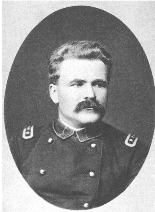
Militärtheoretiker und Radikaler Exponent der «Neuen Richtung» im Fin de Siècle: Ferdinand Affolter.