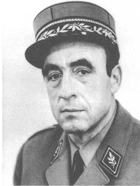
Letzter Verfechter der «Nationalen Richtung»? Alfred Stutz als Direktor der Militärwissenschaftlichen Abteilung der ETH Zürich.

Die Konzeption 66 der militärischen Landesverteidigung diente der Schweizer Armee von 1966 bis 1994 als Heilige Schrift, welche Kampfverfahren, Mittel und Ziele des militärischen Kampfs festlegte, aber auch die Grenzen der Rüstungsfinanzierung aufzeigte. 1 Herausgegangen ist dieses Dokument aus einem fast 20 Jahre dauernden Konzeptionsstreit um die richtige Ausstattung und Kampfweise der Schweizer Armee nach Ende des Zweiten Weltkriegs. Ein Streit, bei dem es um mehr ging als um Flugzeuge, Panzer und Kanonen: Es ging um die dem Schweizer Volk adäquate Form der Landesverteidigung nach der ernüchternden Erfahrung im Zweiten Weltkrieg. Durch das tiefe Niveau der Mechanisierung und Motorisierung der Armee und der Einkreisung durch die Achsenmächte war damals nur noch der Rückzug ins Alpenréduit übrig geblieben.