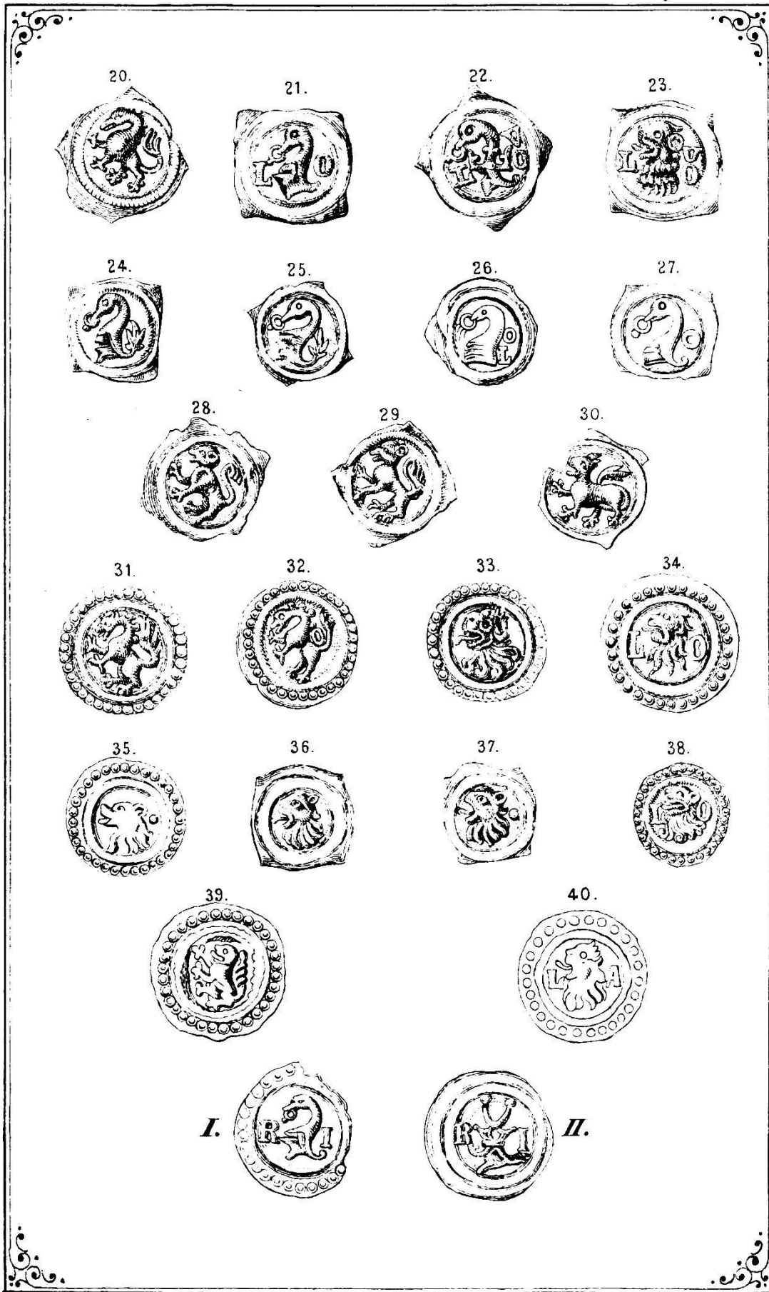
Laufenburger Münzen, (Herrschaftliche & städtische.)