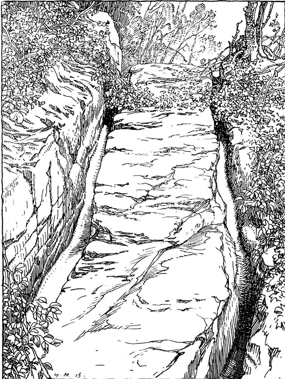
Der helvet.-römische Karrenweg am Bözberg, „Im Berg“ oberhalb Effingens. Klischee der Brugger Neujaarsblätter 1922.

c) Um 1510 war im Zuge der Wege zum Gotthard nur noch der Bözberg eine Erinnerung an die Tage, wo die Habsburger sich mit dem Gedanken beschäftigen konnten, den Gotthard-Paß selbst zu gewinnen. 9