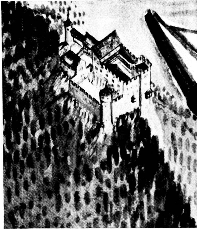
Abb. 1. Schenkenberg nach G. F. Meyer 1682.