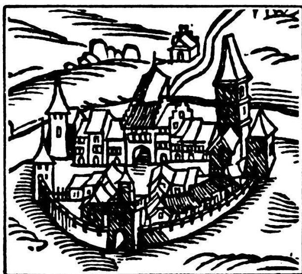
Mellingen, aus der Landtafel des Josua Murer von Zürich, 1566

Vermutlich hat es die Stadtherrschaft einem der Ministerialen zu Lehen gegeben. Es hat seinen Lehensstatus immer bewahrt. Seine Schicksale im 13. und 14. Jahrhundert sind unbekannt. Vermutlich kam es Ende des 14. oder anfangs des 15. Jahrhunderts in den Besitz eines nichtministerialischen Mellinger Bürgers. 48 Kurz vor dem 2. Dezember 1435 ging es aus dem Besitz des Mellinger Bürgers Rudolf Gebisdorff durch Kauf an die Stadt über. Da die österreichischen Lehen 1415 zu Reichslehen geworden waren, 49 nahm Hans Ulrich Segesser das Haus als Lehenträger der Stadt am 2. Dezember 1435