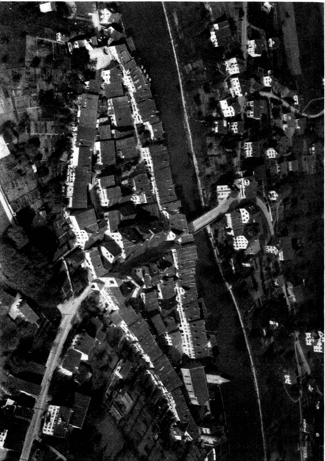
Mellingen aus der Vogelfchau