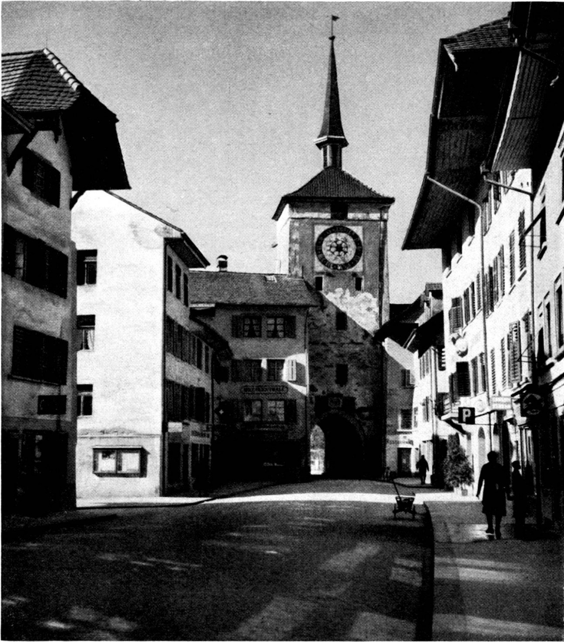
Marktgasse gegen das Lenzburgertor