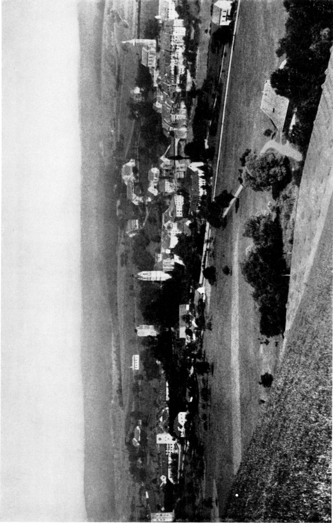
20. Laufenburg von Süden, um 1880