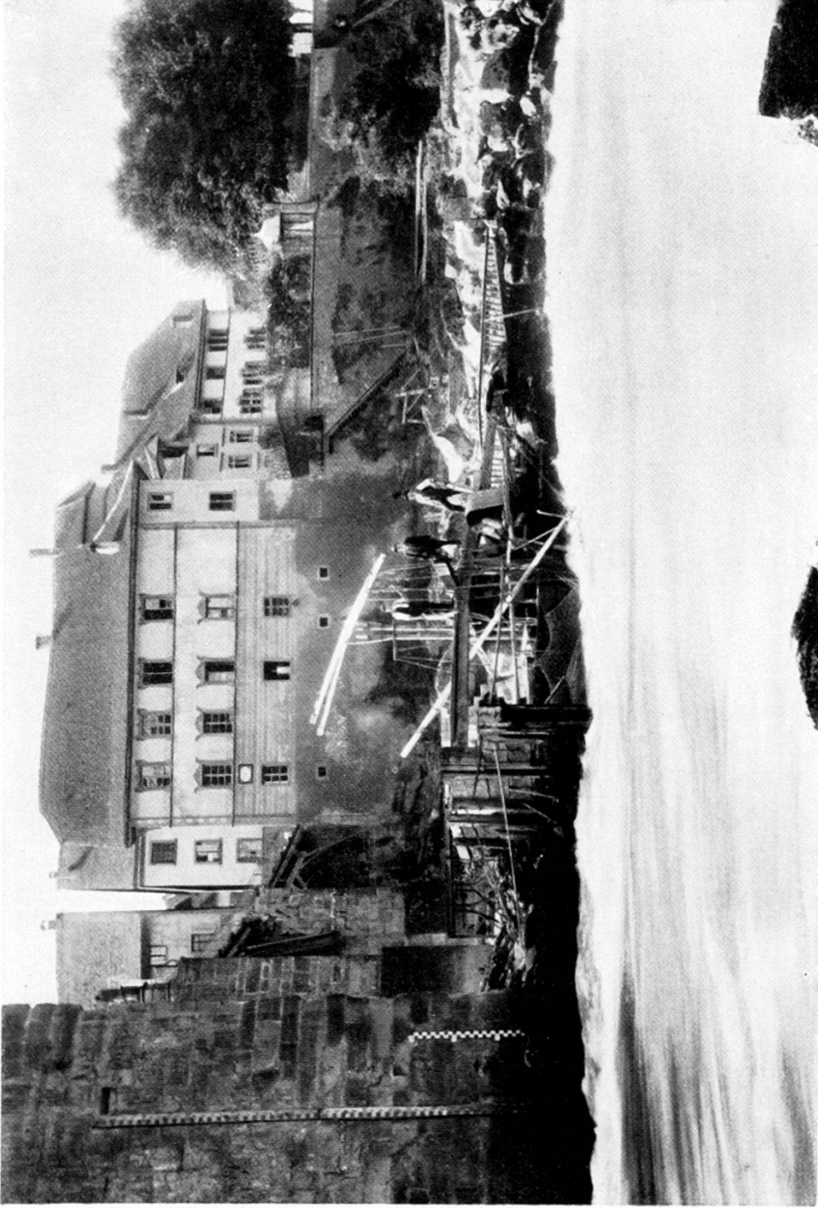
19. Altes Gemeindehaus; im Vordergrund der Hügen