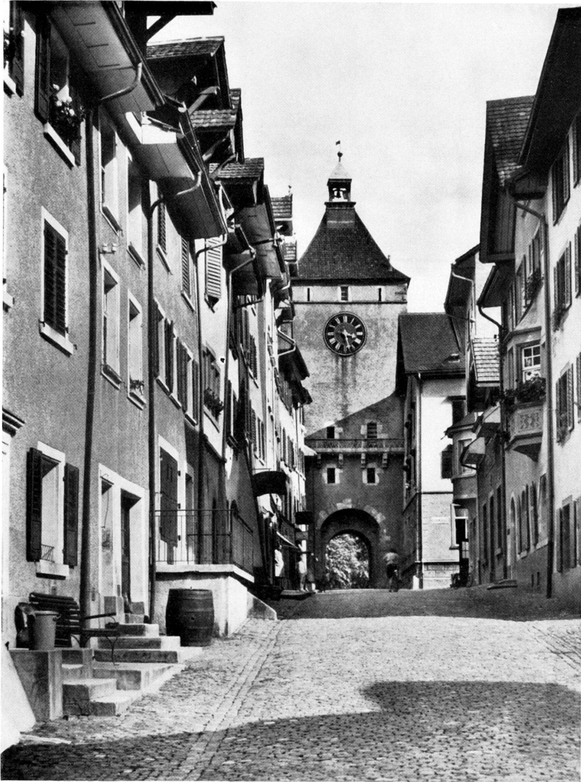
27. Obere Wasengasse