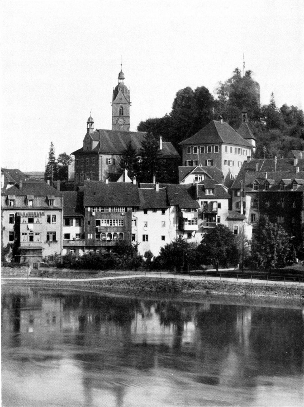
26. Gerichtsgebäude und Pfarrhaus