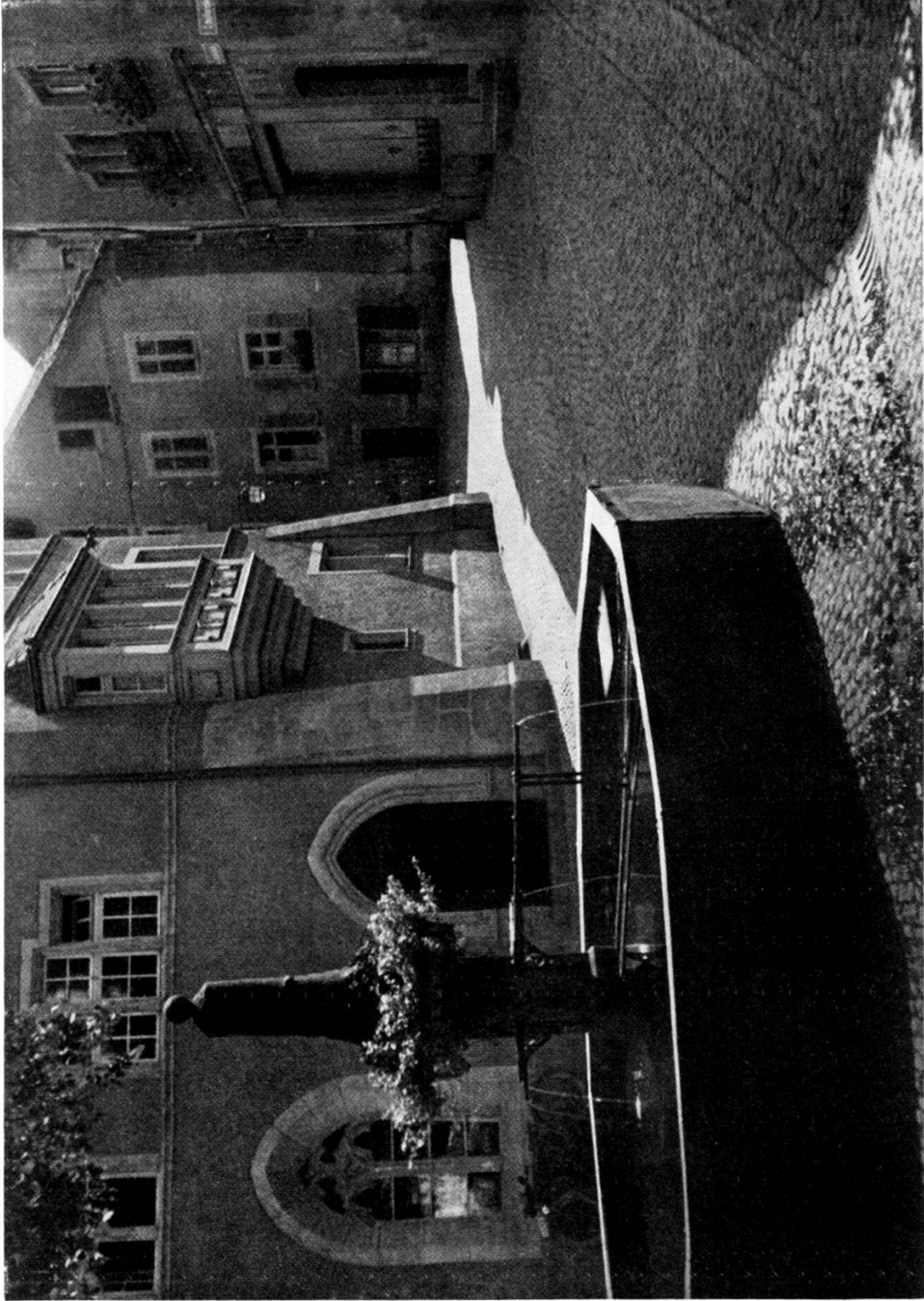
28. Ehemaliger Spital, heute Rathaus