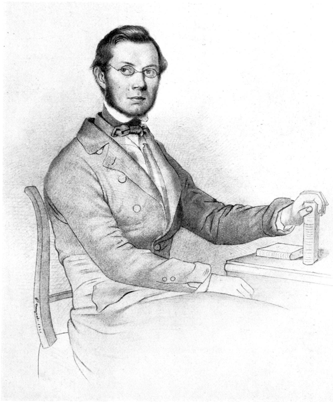
ERNST LUDWIG ROCHHOLZ