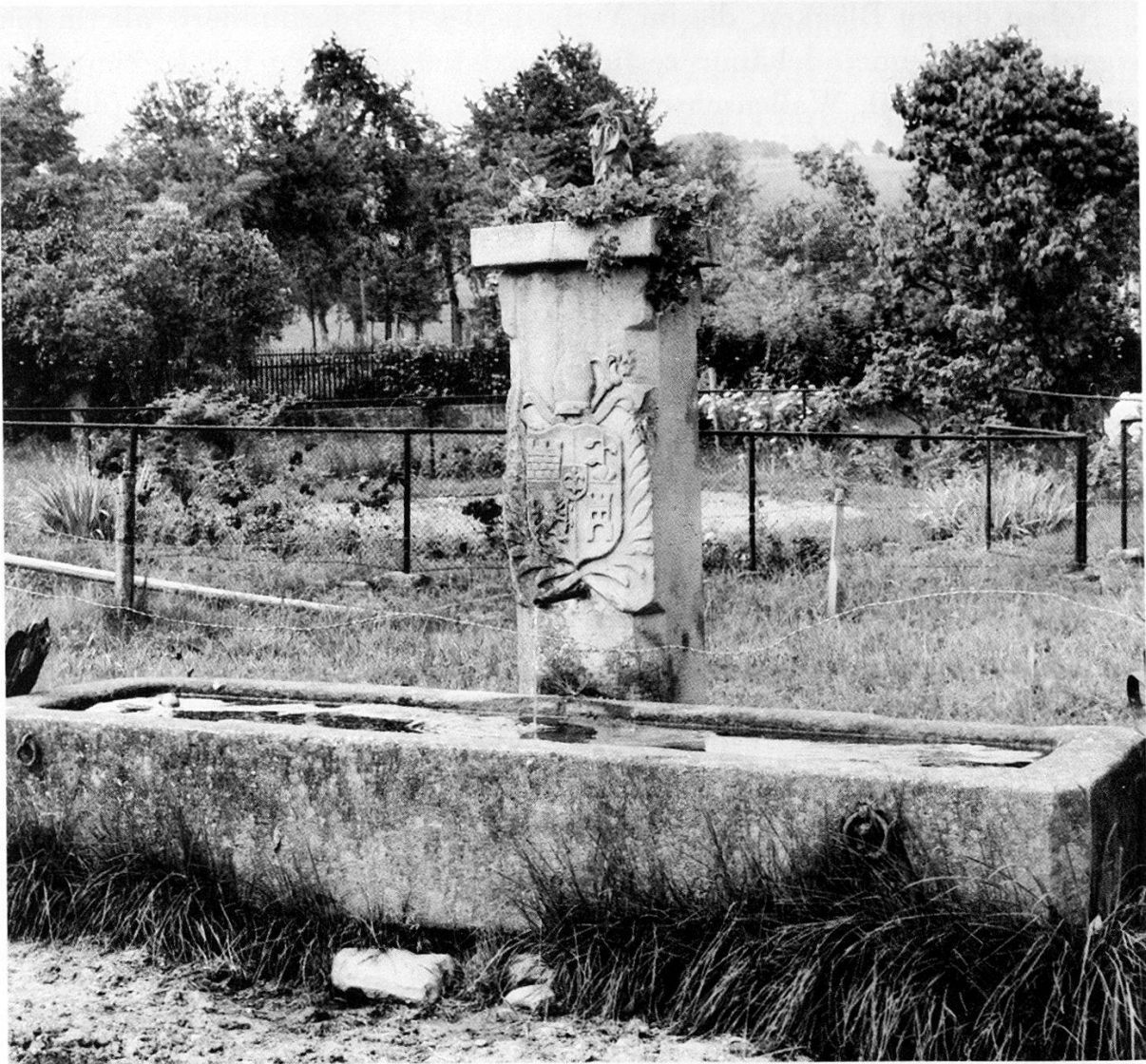
Abbildung 13 Brunnen mit Wappen des Abts Plazidus Zurlauben in Muri/Wili