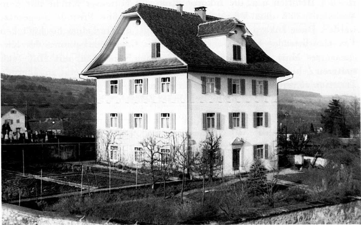
Abbildung 10 Pfarrhaus Muri heute