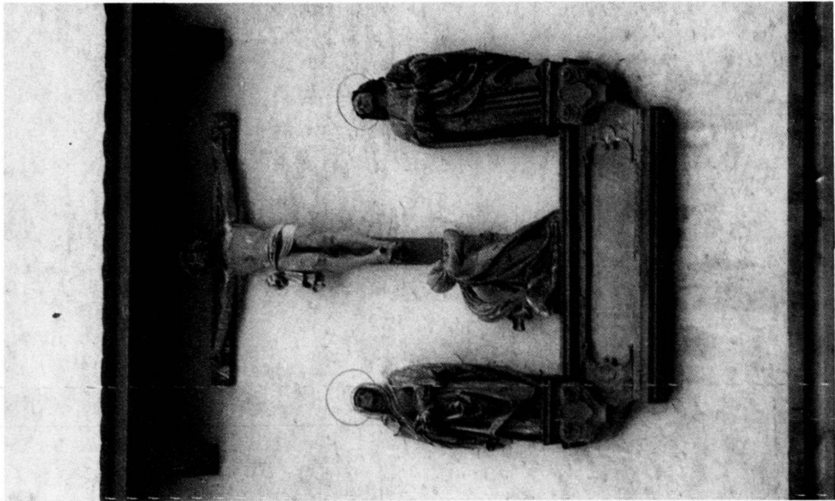
Abbildung 12 Pfarrhausportal